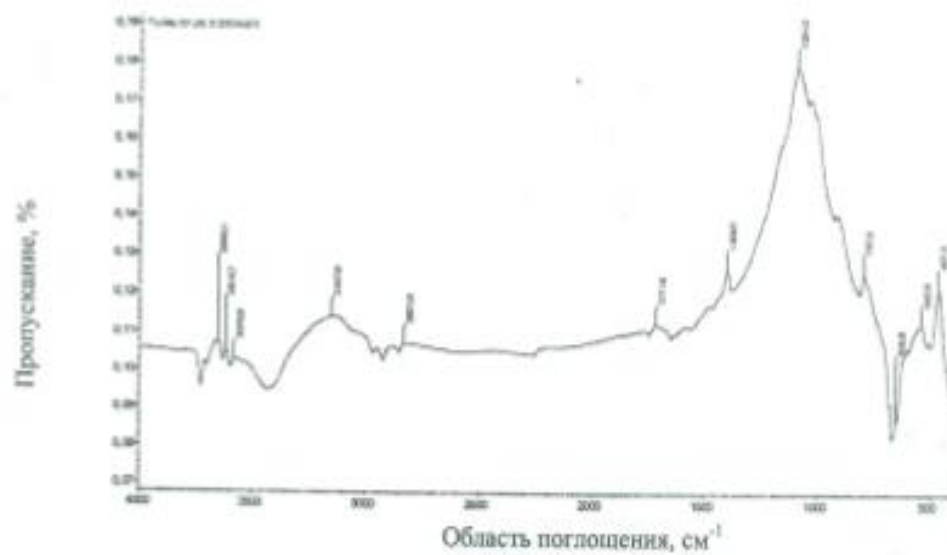
Рис. 5. ИК-спектр антимонита Sb 2 S 3